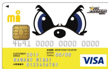
サンロッカーズ渋谷 エムアイカード