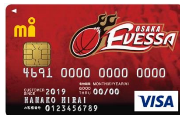
大阪エヴェッサ エムアイカード