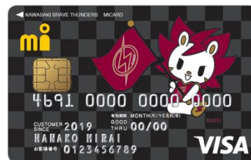
川崎ブレイブサンダース エムアイカード