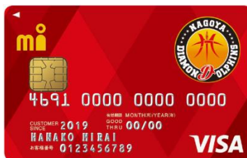
名古屋ダイヤモンドドルフィンズ エムアイカード